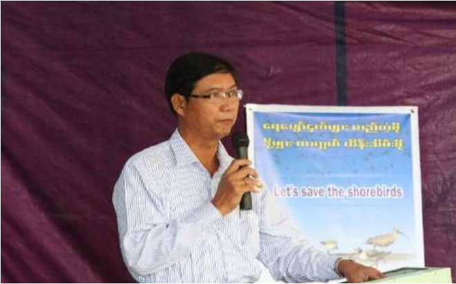
Briefing of Regional Minister (Mine and Forestry)