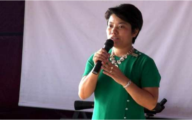
Briefing of BANCA chairperson