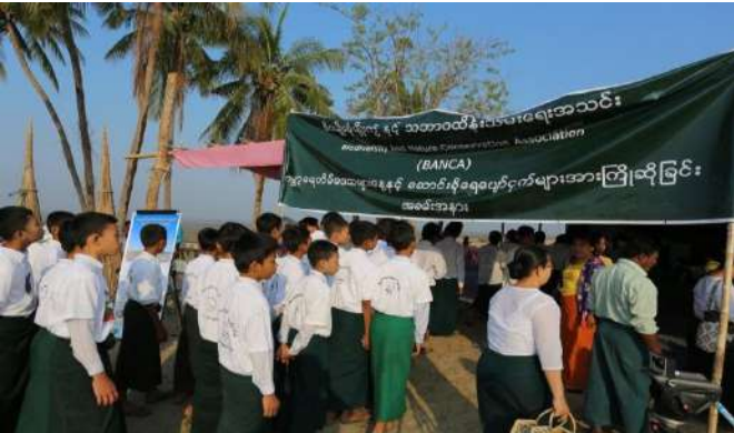
Marching along Ahlat village