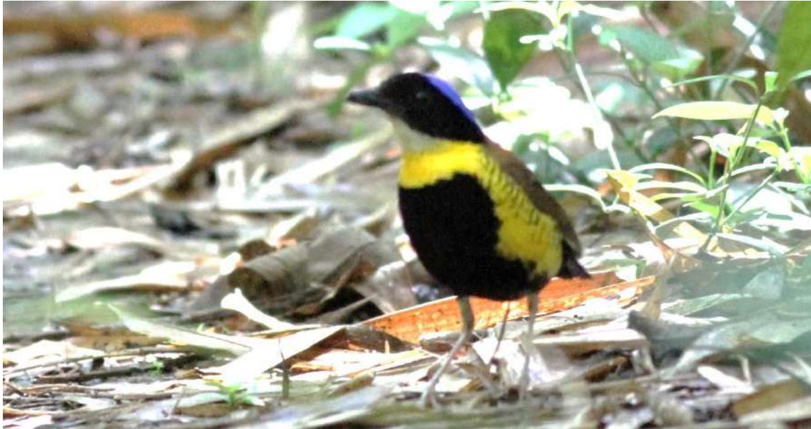
Gurney's Pitta Pitta gurneyi (EN)

This year survey was done in proposed Lenya National Park, south Tanintharyi (Tenasserim) in the primary degraded and bamboo forest on May 2015. Ten transects and 71 points were completed in the survey sites. Gurney's Pittas were recorded in primary degraded, primary degraded close to limestone, secondary and bamboo forest. Total of six were recorded during the survey: four from three survey points and two from forest near the camps were recorded. Total of 259 bird species including Gurney's Pitta were recorded. One new species for Myanmar, Grey-tailed Tattler Tringa brevipes , was recorded from the mudflat where the Critical Endangered species of Spoon-billed Sandpiper have been recorded in early this year from the north-west direction of Myeik city.