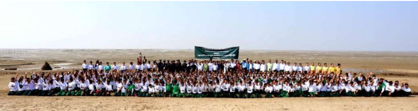
Group photo of participants

ဇီဝမျိုးစုံမျိုးကွဲနှင့်သဘာဝထိန်းသိမ်းရေးအသင်းသည် ဖေဖော်ဝါရီလ (၁)ရက်နေ့တွင် ကမ္ဘာ့ရေတိမ်ဒေသနေ့ နှင့် ဆောင်းခိုငှက်များအားကြိုဆိုခြင်းအခမ်းအနားကို မုတ္တမပင်လယ်ကွေ့၌ကျင်းပခဲ့ပါသည်။ ထိုအခမ်းအနားကို မွန်ပြည်နယ် ပြည်နယ်ဝန်ကြီး၊ သစ်တောဦးစီးဌာန၊ သတ္တုနှင့်သစ်တောဝန်ကြီးဌာန၊ ပြည်တွင်းပြည်ပအဖွဲ့အစည်းများနှင့်ဒေသခံပြည်သူ များတက်ရောက်ခဲ့ကြပါသည်။