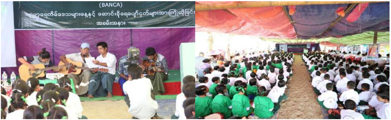
Singing songs for migratory birds