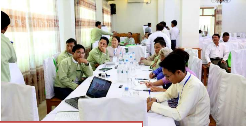
We conduct the surveys

ဇီဝမျိုးစုံမျိုးကွဲနှင့်သဘာဝထိန်းသိမ်းရေးအသင်းသည် မိုးယွန်းကြီးအင်းရေတိမ်ဒေသတွင်ဖေဖော်ဝါရီလ၌ရေတိမ်ဒေသဂေဟစနစ်ဝန်ဆောင်မှုများကိုတိုင်းတာပြီးတန်ဖိုးဖြတ်တိုင်းတာခြင်းကို Birdlife International, Ministry of Environment, Japan နှင့်သစ်တောဦးစီးဌာနတို့နှင့်ပူးပေါင်းဆောင်ရွက်ခဲ့ပါသည်။ ထိုသို့ရေတိမ်ဒေသဂေဟစနစ်ဝန်ဆောင်မှုများကိုတိုင်းတာရာတွင် မိုးယွန်းကြီးအင်းရေတိမ်ဒေသပတ်ဝန်းကျင်ရှိရွာများမှဒေသခံများကိုဖိတ်ကြားပြီး မေးခွန်းများမေးမြန်းခဲ့ကြပါသည်။ ထိုသို့မေးမြန်းရာမှရလာသောရလဒ်များကို Brochure နှင့် Leaflet များတွင်ထည့်သွင်းကာ သက်ဆိုင်ရာအစိုးရဌာနများနှင့် ဒေသခံများသို့ပြန်လည်ဖြန့်ဝေခဲ့ပါသည်။