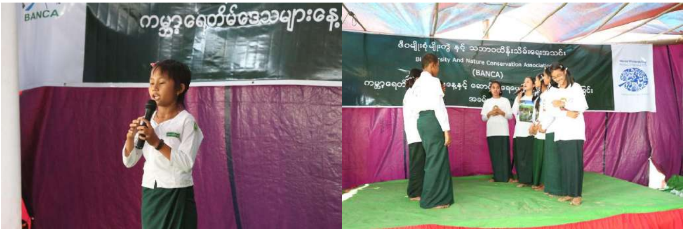
Story telling competitions