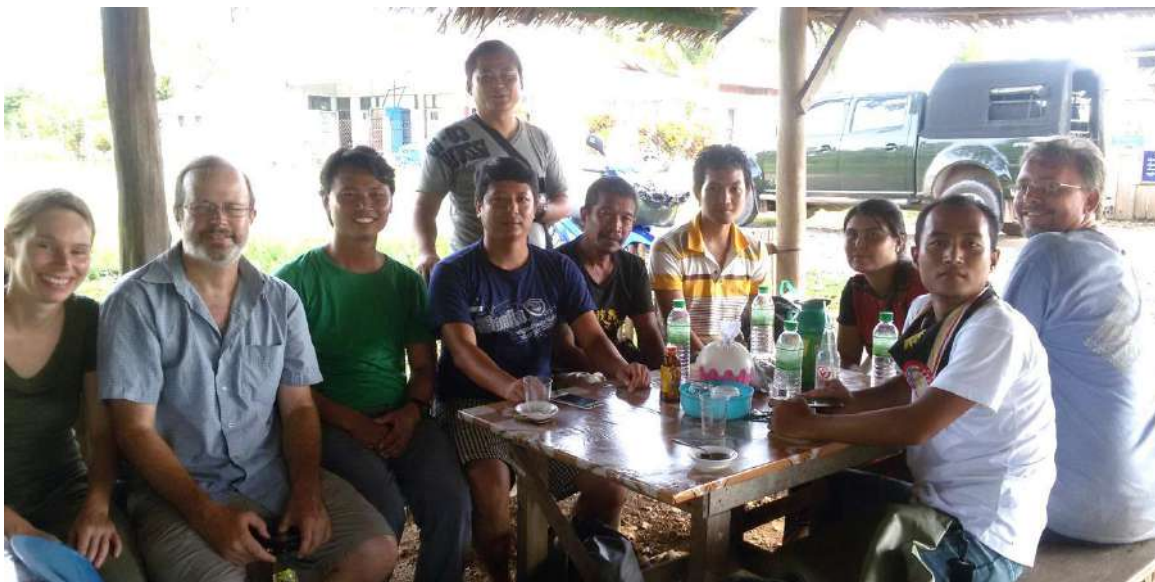
Biodiversity Survey team from BANCA and FFI